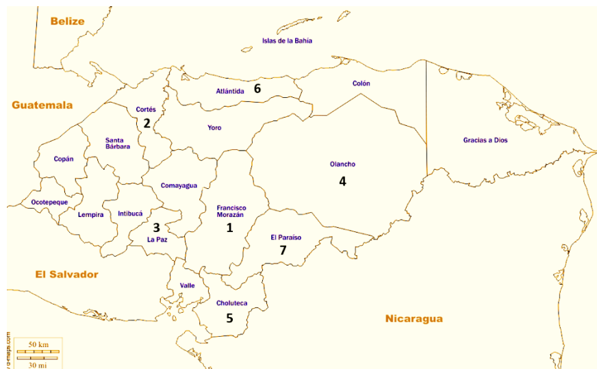
Figura 2. Departamentos de origen de los pacientes que recibieron consulta telemedicina.

Tanto para los médicos del Consultorio Solidario Virtual como para los pacientes, el uso de la telemedicina les brindó protección evitando posibles contagios con COVID-19, permitiendo al paciente ser atendido cuantas veces lo necesitara sin exponerse. Los pacientes en riesgo se beneficiaron de quedarse en casa, se redujo la exposición a otros que pudieran ser portadores de coronavirus y recibieron atención médica con resolución de consultas de forma inmediata y con satisfacción, como han reportado otros autores (Elkbuli et al., 2020). Un beneficio observado fue que cierto número de personas con enfermedades crónicas o de edad avanzada fueron atendidos ante su falta de acceso a sus clínicas donde son atendidos de forma rutinaria. Esto indica que el uso de la telemedicina puede evitar que se descontinue la atención médica de ese grupo de pacientes considerado más vulnerable en su salud (Ohannessian & Duong, 2020).