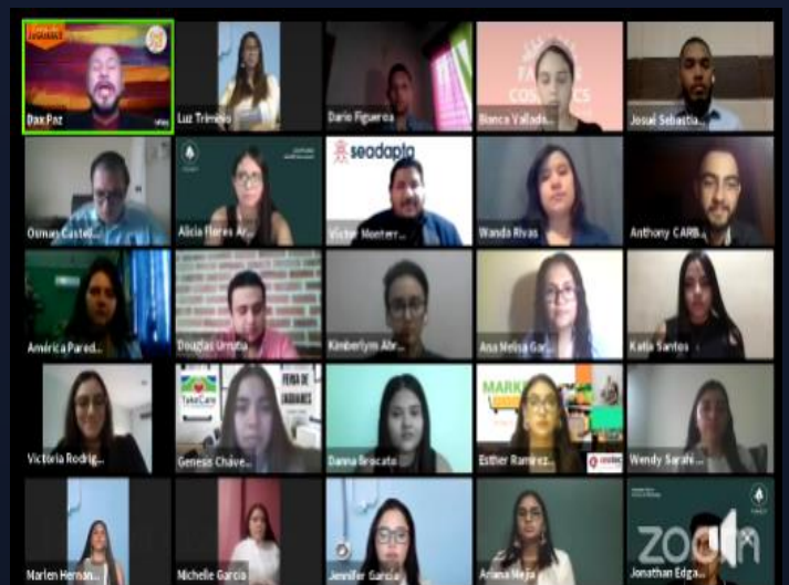
Figura 3 Primera edición de Jaguar cage presentando ideas de negocio en inglés por medio de la técnica del pitch.

Contacto: dax.paz@unitec.edu.hn Conflicto de interés: ninguno