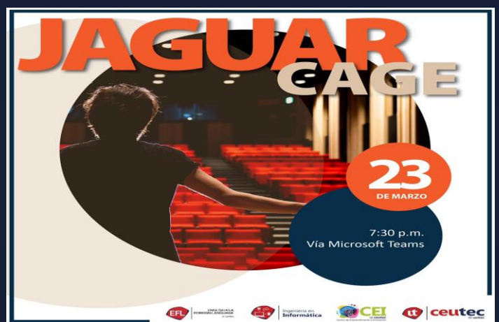
Fig. 1 Arte del evento Jaguar Cage utilizando la técnica del pitch.

Se recomienda hacer extensivo la implementación de esta técnica en todas las asignaturas que los alumnos presenten proyectos finales por medio del discurso, ya sea en otras clases de inglés avanzado o en español.