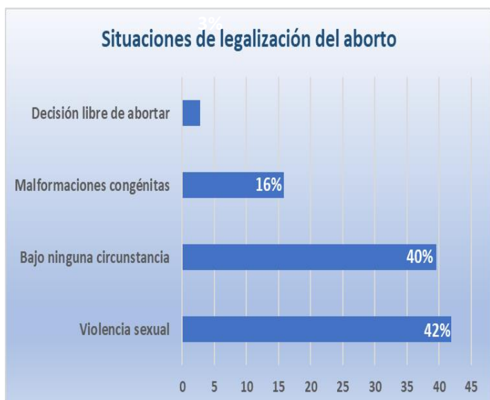
Figura 2. Situación de legalización del aborto.