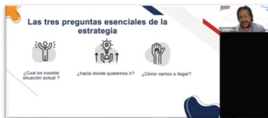
Figura 4. Presencia Cognitiva: construcción, reflexión e indagación.

Presencia Cognitiva: Se mostró un hecho desencadenante invitando a los estudiantes a la exploración, integración y resolución para identificar las distintas asignaciones y evaluaciones del aprendizaje, se utilizó el principio de multimedia y se generó un ambiente de intercambio de ideas en doble vía al implementar recursos tecnológicos.