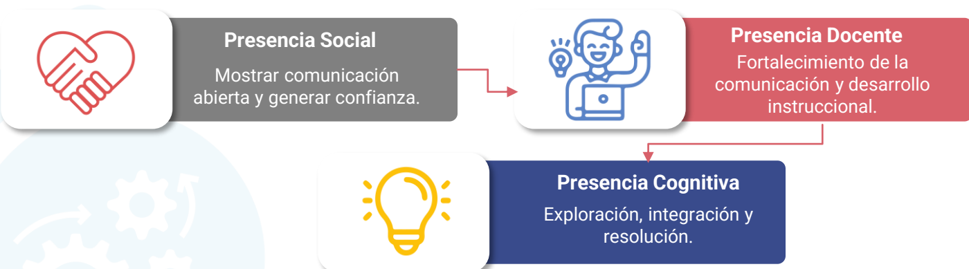
Figura 1. Modelo de comunidad de indagación.

La ejecución de un aprendizaje pertinente con capacidad para generar motivación y compromiso, en entornos virtuales fue realizado a través del modelo de comunidad de indagación el cual consiste en tres elementos: