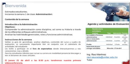
Figura 3. Presencia Docente fijando objetivos y competencias.

Presencia Docente: Fortalecimiento de la comunicación semanal. Se mostró un mensaje de bienvenida personalizado, se fijó el programa, objetivos y actividades a desarrollar, las instrucciones fueron directas y se facilitó el diseño y organización. En cada reunión, se activó la cámara para fomentar la presencia docente, se colocaron dinámicas interactivas utilizando herramientas multimedia.