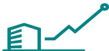
Fig. 4 Factoraje Internacional

Con esa liquidez continuas con tu productividad y crecimiento.