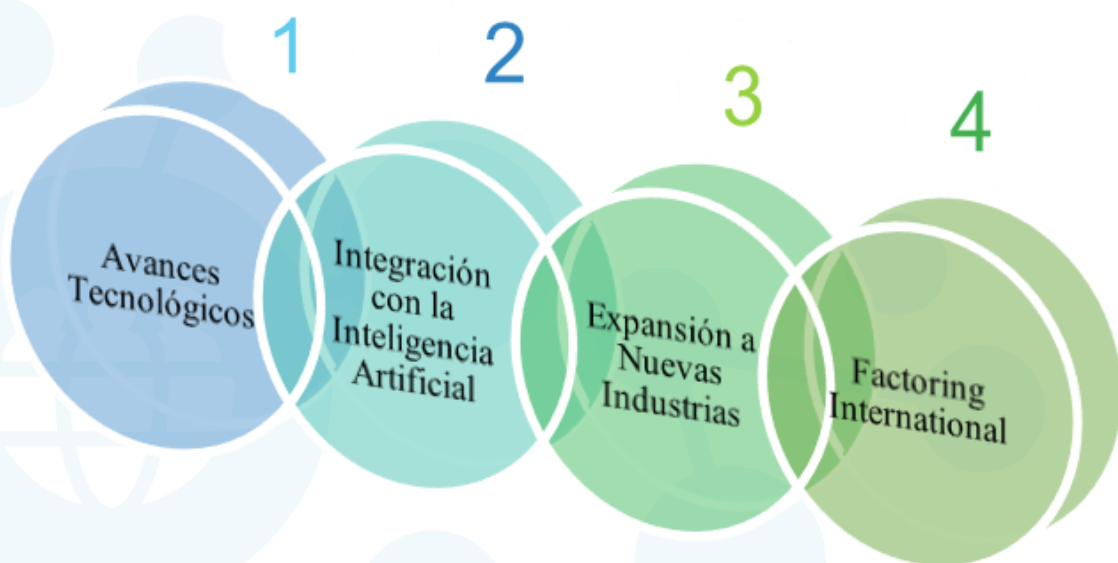
Fig. 3 Tendencias y Oportunidades emergentes