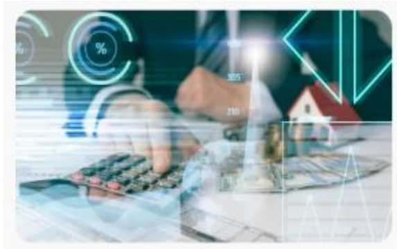
Fig. 5 Crecimiento del 44% del factoring en Latinoamérica.

Medidas fundamentales a desarrollar para el perfeccionamiento del factoraje internacional en transacciones electrónicas en Honduras: un marco regulatorio adecuado, entidades promotoras y una estrategia de expansión.