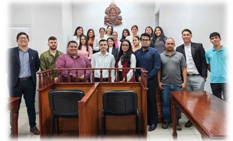
Imagen 1. Simulación judicial clase Personas y Familia.

La simulación judicial en derecho desempeña un papel integral en la formación legal, ética y la preparación de litigios de los estudiantes de derecho. Su influencia es innegable, ya que proporciona una experiencia de aprendizaje inmersiva y contextualizada que prepara a los estudiantes para los desafíos profesionales.