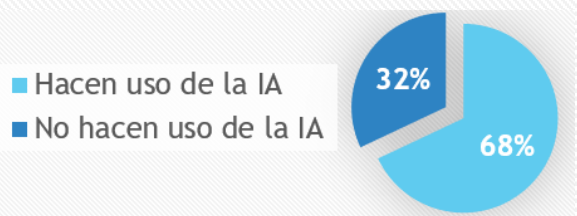
Gráfico 4. ¿Haces uso de la IA para fines académicos?