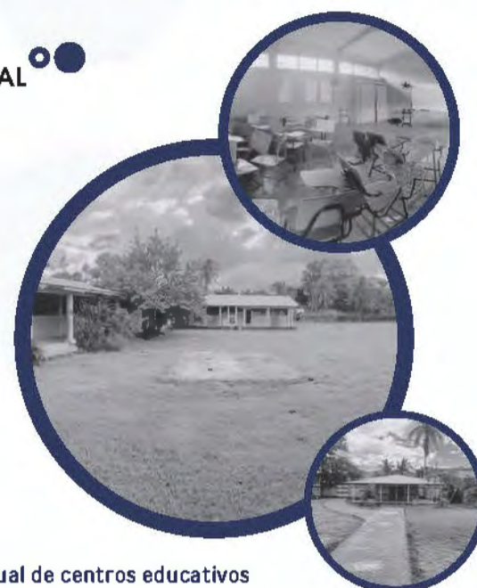
Figura 4. Situación actual de centros educativos