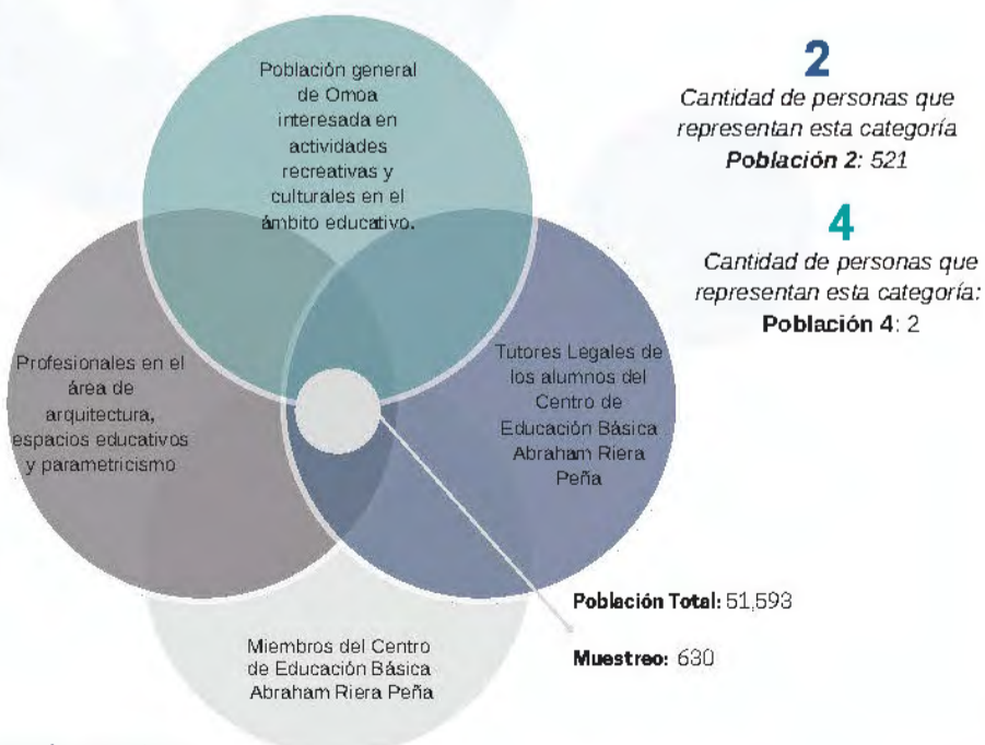
Figura 2: Diagrama de muestreo

Contacto: f_cwu21@unitec.edu vickyparod26@unitec.edu Conflicto de interés: ninguno