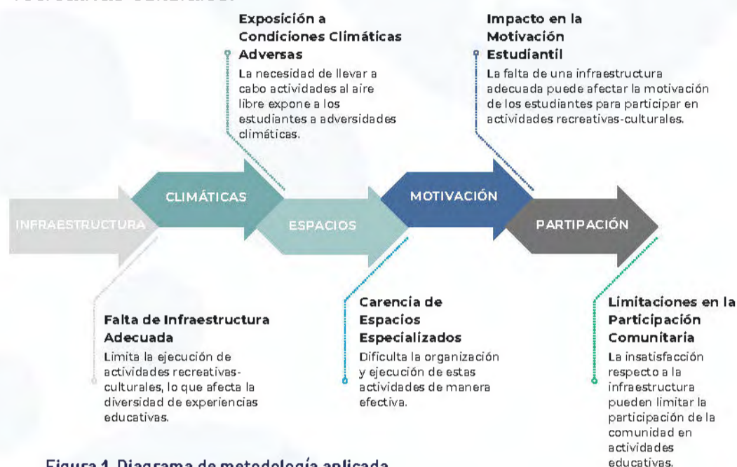
Figura 1. Diagrama de metodología aplicada

A nivel prebásico el municipio cuenta con 19 centros educativos, 52 para el nivel básico y 5 para el nivel medio (INE, 2020) . Los centros educativos carecen de espacios especializados para albergar actividades recreativas-culturales.