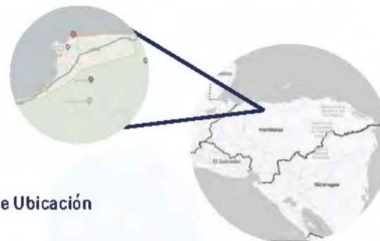
Figura 3. Mapa de Ubicación

El municipio de Omoa está en la costa norte de Honduras, en el departamento de Cortés.