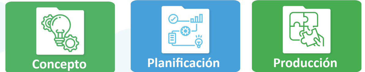
Fig. 1 Pasos realizados para construir el escape room.

En los últimos años, la gamificación ha emergido como un enfoque innovador para la enseñanza en distintos contextos educativos. Alineados a dicha estrategia, los escape rooms han ganado relevancia como una técnica valiosa para el desarrollo de habilidades profesionales en los estudiantes universitarios. Entre estas, destacan el trabajo en equipo, la resolución de problemas, la comunicación, la gestión del tiempo y el enfoque en resultados.