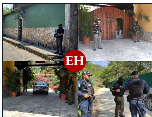
Cortesía OTV Digital, (2022, abril 01). Haciendas y hoteles, propiedad de la familia Hernández Alvarado [Fotografía]. En Así se ejecutan los aseguramientos de los bienes de la familia Hernández en Lempira. El Heraldo. https://www.elperiodico.hn/fotogaleria/aseguramientos-bienes-familia-gil-hermandez-lempra-estradiol-SE-704225/#image-1