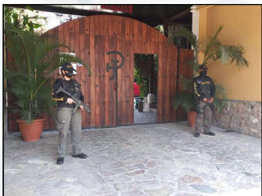
El Heraldo, (2023, julio 03). La Posada de Don Juan en Gracias, Lempira, fue uno de los bienes asegurados en abril del año pasado [Fotografía]. En OABI difiere del MP en lista de bienes de Juan Orlando Hernández. El Heraldo. https://www.elperiodico.hn/honduras/oabi-difiere-mp-lista-bienes-juan-orlando-hermandez-1514216340