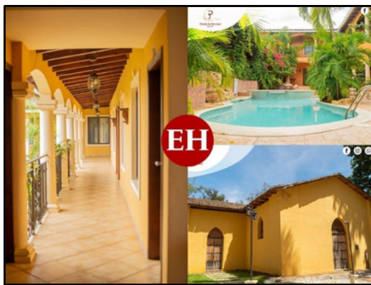
El Heraldo, (2023, abril 01). Bienes a nombre de Juan Orlando Hernández a los que se les autorizó el aseguramiento e incautación de bienes [Fotografía]. En Así se ejecutan los aseguramientos de los bienes de la familia Hernández en Lempira. El Heraldo. https://www.elperiodico.hn/fotogaleria/aseguramientos-bienes-familia-gil-hermandez-lempra-estradiol-SE-704225/#image-1

Además, enfatiza la necesidad de educar a futuros periodistas en estas prácticas para prepararlos como profesionales éticos.