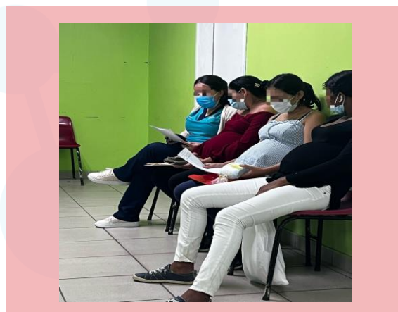
Figura 1. Aplicación de encuesta. (fotografía autorizada)