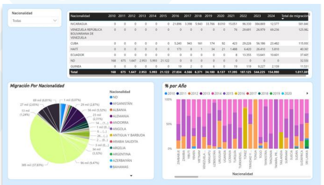
Fig. 1 Tablero de tendencia migratoria por año