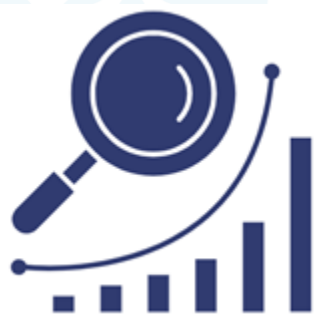
Figura 2. Análisis de datos con enfoque cualitativo.