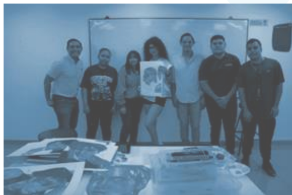
Figura 5. Grupo de estudiantes interculturales en el aula universitaria de CEUTEC.

A pesar del progreso en la promoción de la diversidad cultural en Honduras, persisten desafíos en la promoción de la interculturalidad en la universidad (ver figura 5).