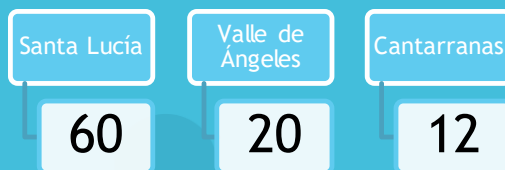
Figura 2. Comercios que aceptan pago en Bitcoin Valley, Honduras