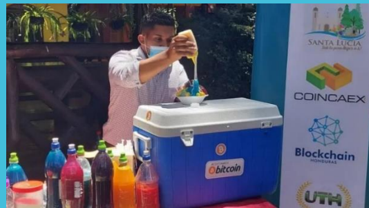
Figura 1. Negocio que acepta Bitcoin en Santa Lucía, Honduras.

Honduras también alberga Próspera, una ciudad en la zona económica especial en la isla de Roatán donde BTC se convirtió en curso legal en 2022 y se designó como unidad de cuenta en enero. No está claro cómo afectará la resolución de la CNBS a esas áreas, si bien la circulación otorga a los comerciantes mayor libertad para comercializar sus productos utilizando esta criptomoneda, debido a limitaciones tecnológicas y regulatorias, no es posible realizar el pago de impuestos en ella por el momento.