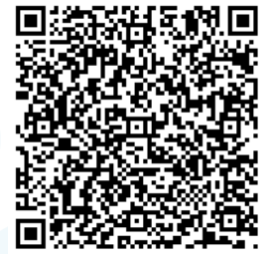
Figura 1. Código QR para acceder al tablero

El estudio reveló una tendencia alcista notable en el portafolio de créditos y captaciones. El 91.57% de los activos del sector se destinan a generar rentabilidad, respaldado por una relación positiva entre activos y cartera de créditos, especialmente la vigente. El indicador de apalancamiento de activo sugirió que por cada Lempira de patrimonio se generan L2.29 de activos. La capacidad de convertir los ingresos financieros en utilidad se observó en 85.39%; sin embargo, al incorporar los gastos operativos este se redujo al 25.79% lo que señala un aumento sustancial en dichos gastos y por ende un mayor riesgo de exposición de las entidades frente a dicha situación.