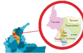
Ubicación Montes de María

Para la realización de este proyecto, los tubérculos se recolectaron en el Municipio de San Jacinto, Bolívar en región de los Montes de María, Caribe Colombiano.