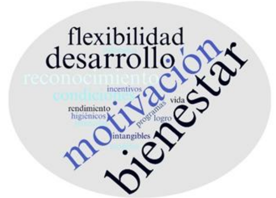
Fig. 2 Autores y sus teorías más frecuentes en otras investigaciones