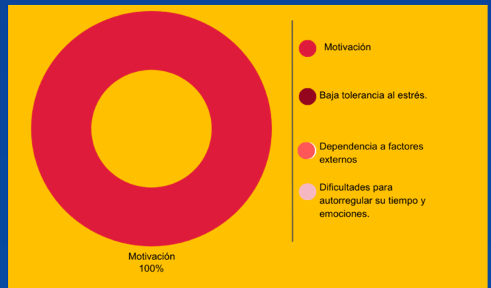
Fig. 2 Factores psicológicos y su impacto.