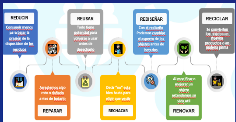
Fig. 1 Las 7 técnicas del reciclaje

El reciclaje es una de las acciones promovidas desde la Educación Ambiental, su conceptualización surge por primera vez como Iniciativa 3 erres, y con la evolución de la problemática ambiental, se vuelve necesario agregar más erres; esta dinámica es parte de Economía Circular y una solución a corto, mediano y largo plazo.