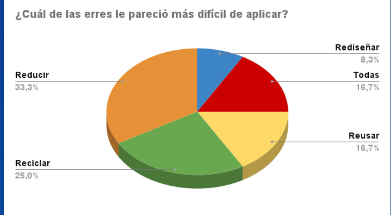
Fig. 2 Consulta sobre la dificultad para aplicar las técnicas del reciclaje