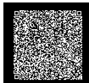
Imagen 2. Código QR

Acceda a este código QR, para mayor información