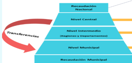
Las transferencias son vitales para las 298 municipalidades del país