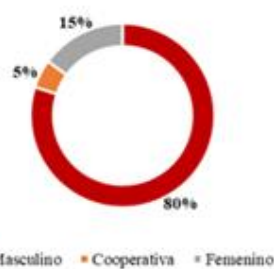
Imagen 1. Tipo de productor que participa en la taza de excelencia.