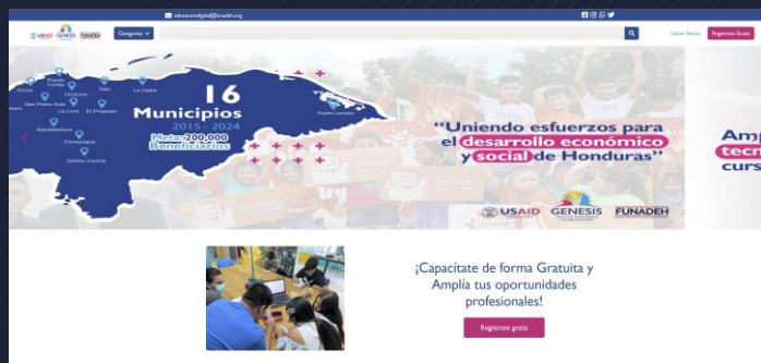
Imagen 1 Plataforma Responsive