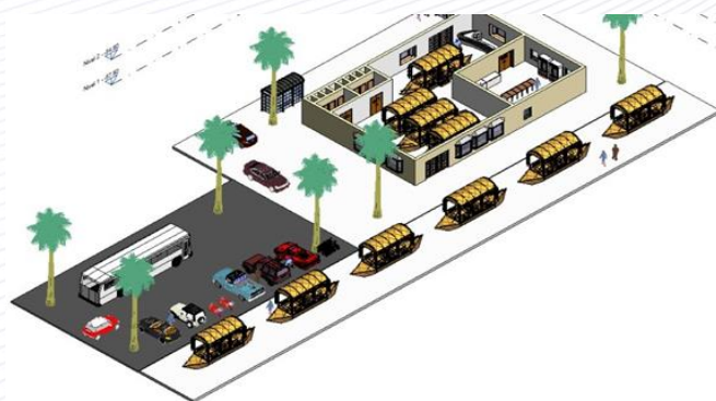
Figura no. 1 Diseño arquitectónico del Bar y Restaurante CAYUCO 1797

Identificar el nivel de aceptación del restaurante por parte de la población ceibeña.