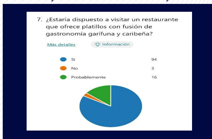
Figura no. 2 Nivel de aceptación del Bar y Restaurante CAYUCO 1797