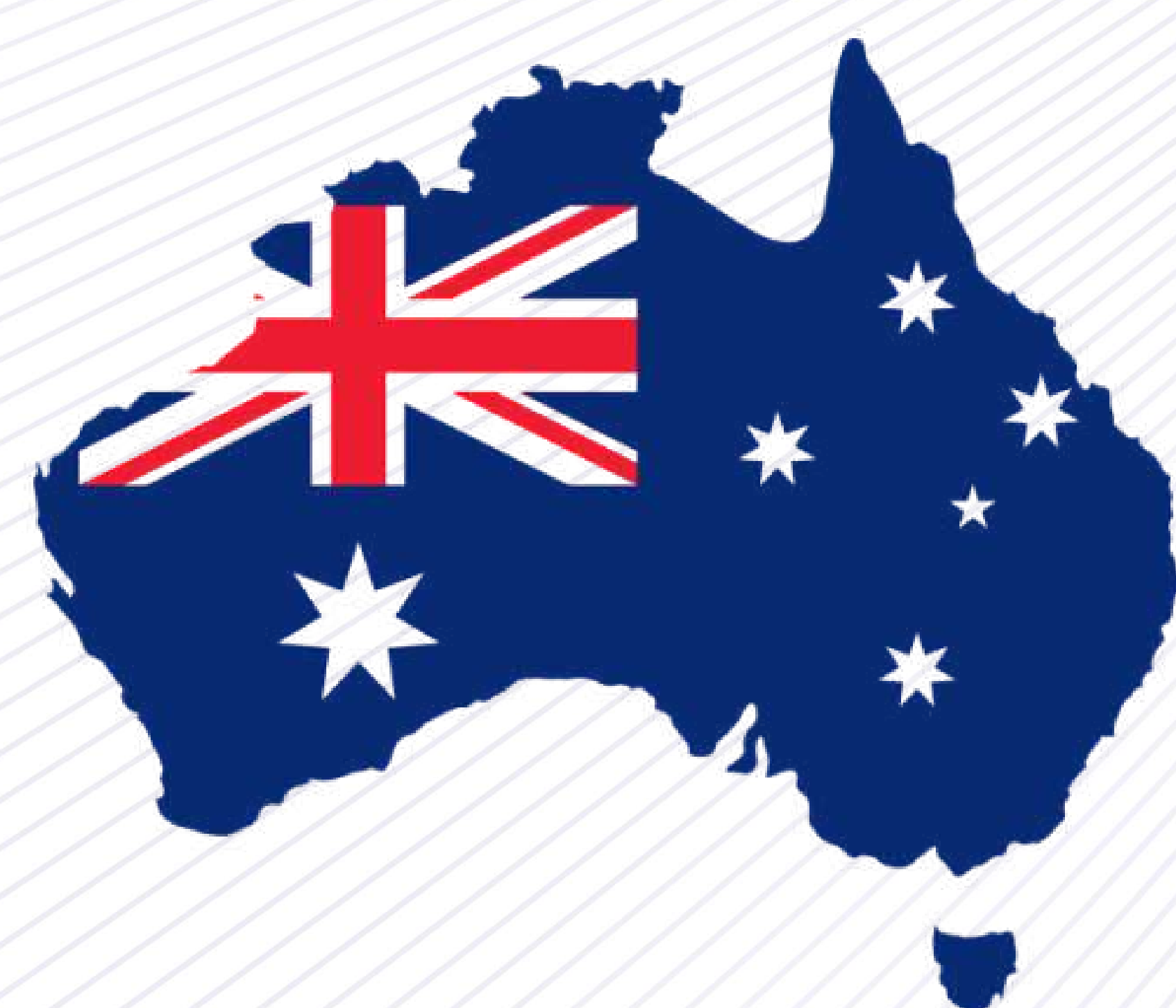
Figura 1. Bandera Australiana Nota. Icono de Flaticon, 2023