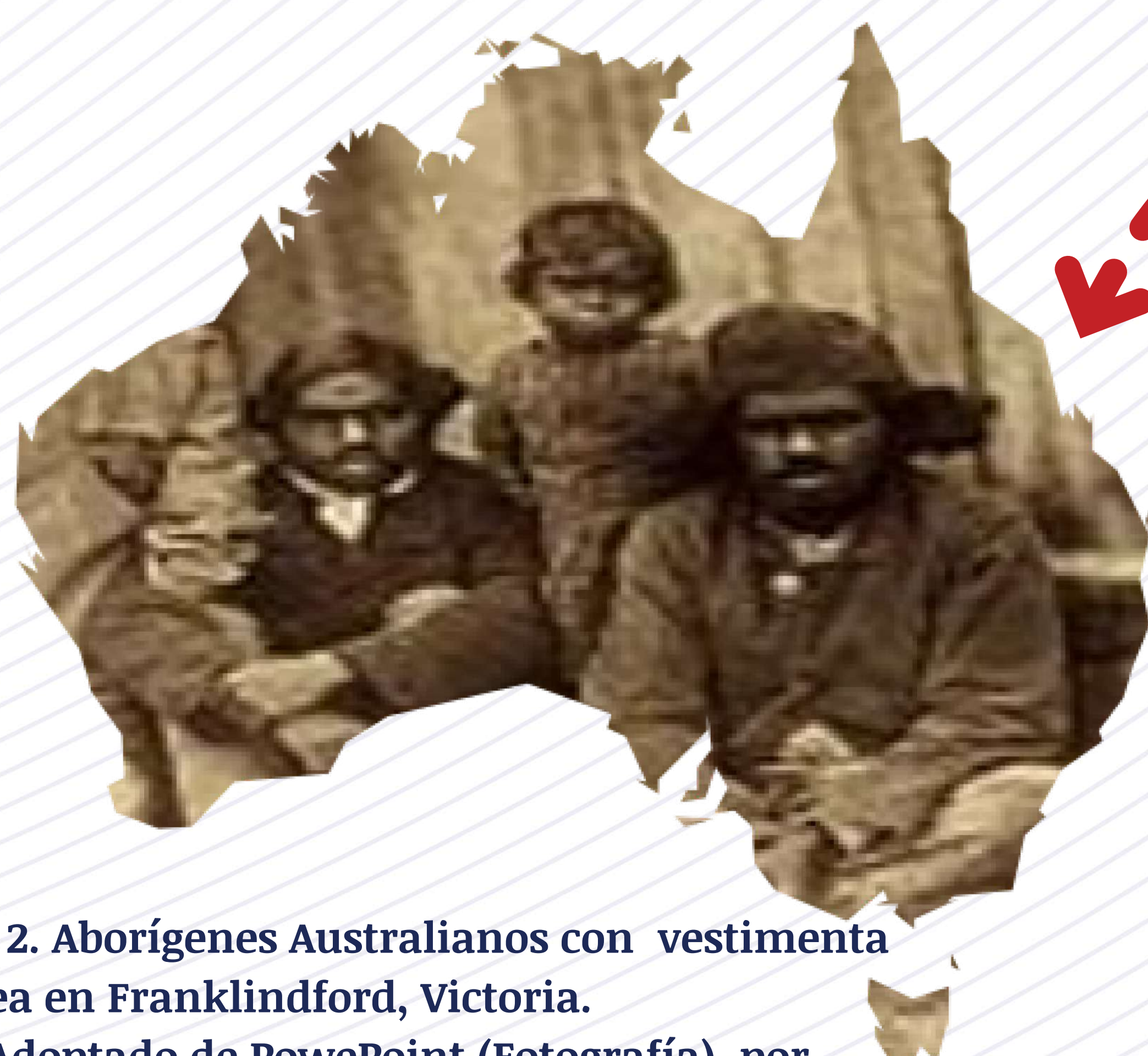
Figura 2. Aborígenes Australianos con vestimenta Europea en Franklindford, Victoria. Nota. Adoptado de PowePoint (Fotografía), por Antoine Fauchery, 1858.