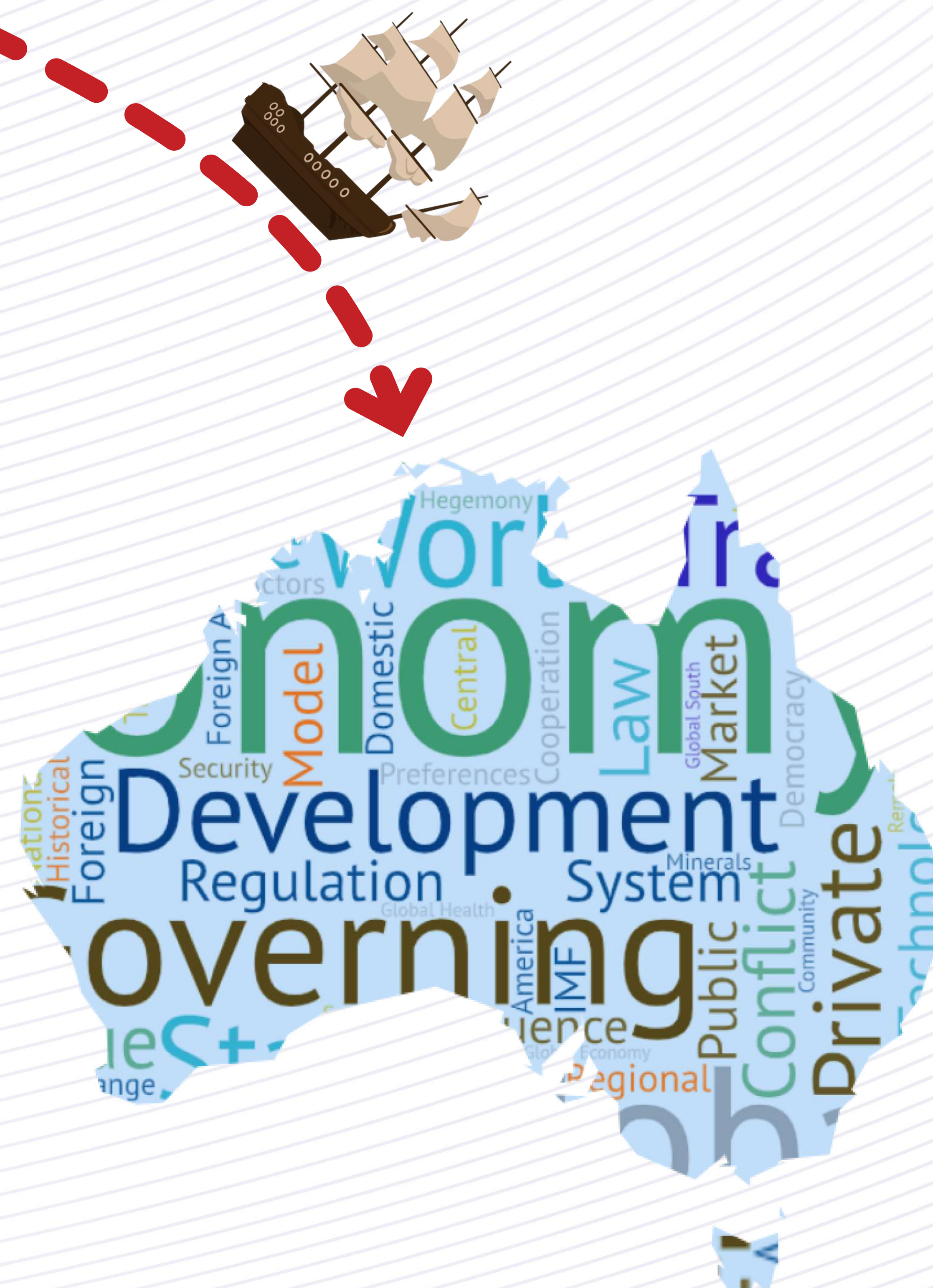
Figura 3. Desarrollo en Australia