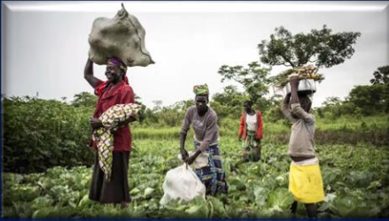
Ilustración 2: