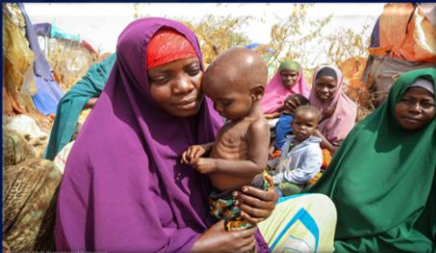
Ilustración 3:

La Seguridad Alimentaria y Nutricional es un derecho fundamental del ser humano, el cual se materializa cuando todas las personas sin distinción tienen acceso físico y económico a cantidades suficientes de alimento seguro y nutritivo, que les permita satisfacer en todo momento sus necesidades alimenticias con el fin de poder llevar una vida sana, activa y digna; sin embargo, este 2023, el legado negativo que ha dejado la pandemia de la COVID-19 y la guerra de Rusia y Ucrania han exacerbado la crisis alimentaria a nivel mundial, especialmente en África.