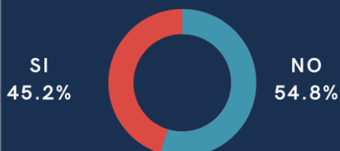
Imagen 2. Resultado de acción para el ODS 10

¿Ha hecho alguna acción en beneficio del ODS10?