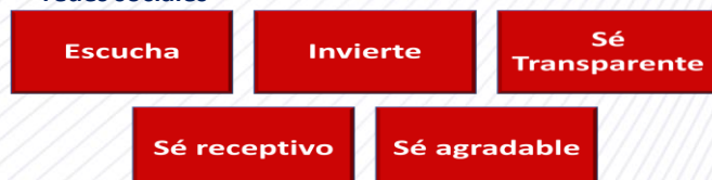
Figura 2. 5 Conceptos Claves para el marketing en redes sociales