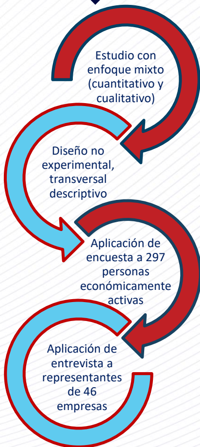
Imagen 2. Metodología utilizada para desarrollar la investigación.