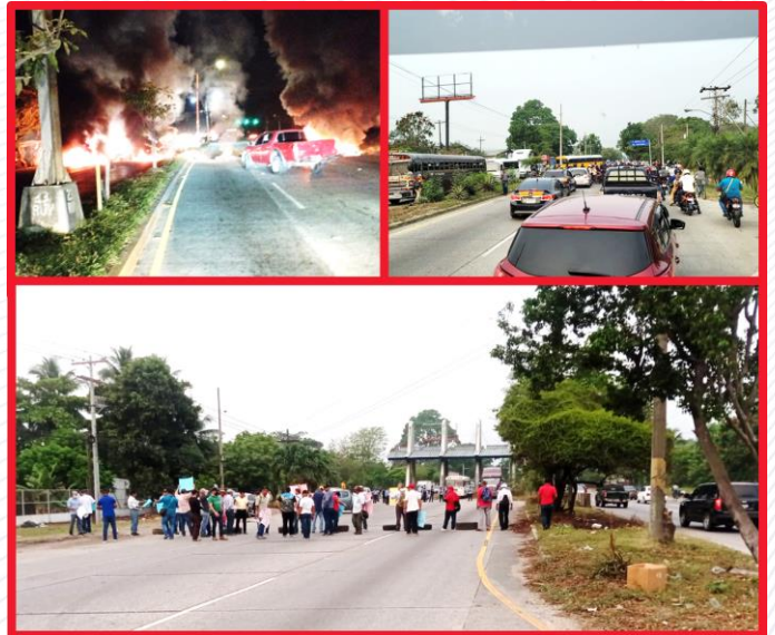
Imagen 1. Protestas viales en el bulevar del Norte, San Pedro Sula, Honduras.

Identificar el impacto socioeconómico del incremento de las protestas viales en la industria y población del Valle de Sula, Honduras.