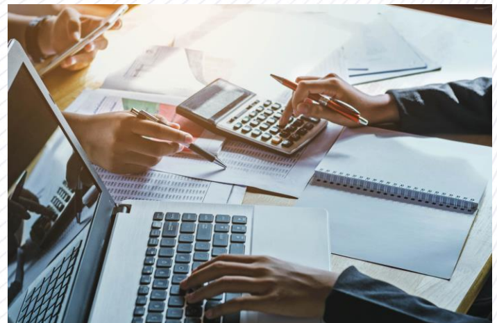
Imagen 1 Toma de decisiones

La implementación de las NIIF en las empresas ha sido un proceso complejo, pero ha generado muchos resultados positivos en términos de manejar la información financiera correctamente. Se requiere una capacitación continua, adquirir un compromiso entre las partes interesadas para garantizar y generar mayor confianza en los estados financieros.