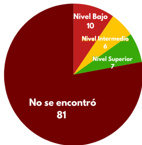
Fig. 2 Gráfico sobre los medios digitales y su nivel de generación y producción de periodismo de investigación.

Este gráfico muestra la cantidad de medios según la escala del tipo de periodismo de investigación que generan.