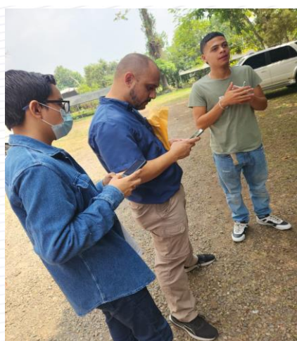
Figura 2. El docente instalando aplicación para toma de datos.