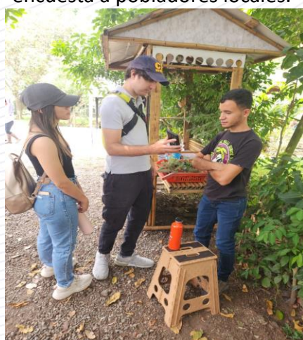
Figura 3. Estudiantes aplicando encuesta a pobladores locales.