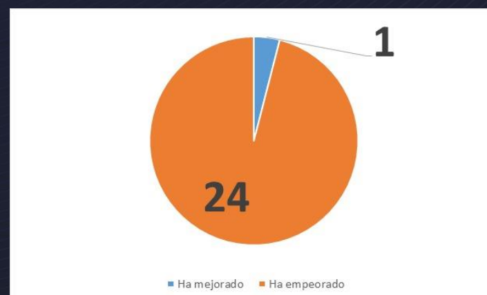
Fig. 3. El 96% de los educadores encuestados aseguran que en los últimos 10 años el nivel de ortografía ha empeorado en los estudiantes en educación media en Honduras.

Contacto: lcruz1979@unitec.edu Conflicto de interés: Ninguno