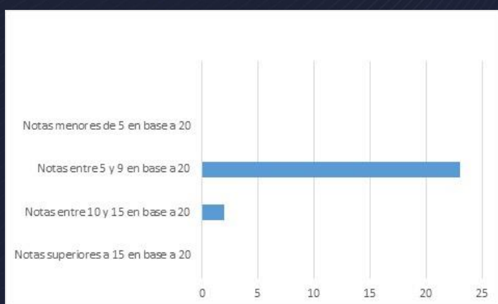
Fig. 1. De los 25 docentes de educación media encuestados, el 100% estuvo debajo de 14 puntos.

Según los datos obtenidos en el test aplicado, se concluye que los docentes del área de Español en educación media, no poseen un buen nivel de ortografía. Además, hay una consciencia que el nivel ortográfico es deficiente en los estudiantes, pero los llamados a corregir esto, tampoco presentan conocimientos gramaticales amplios. Existe una contradicción en lo que el docente cree y la práctica ya que la mayoría cree tener buena ortografía, pero cuando se les aplicó el test, reflejaron lo contrario. Como recomendación, se sugiere que el Gobierno de la República, a través del Ministerio de Educación, agregue de forma obligatoria temas relacionados con ortografía a los temarios de la clase de Español.