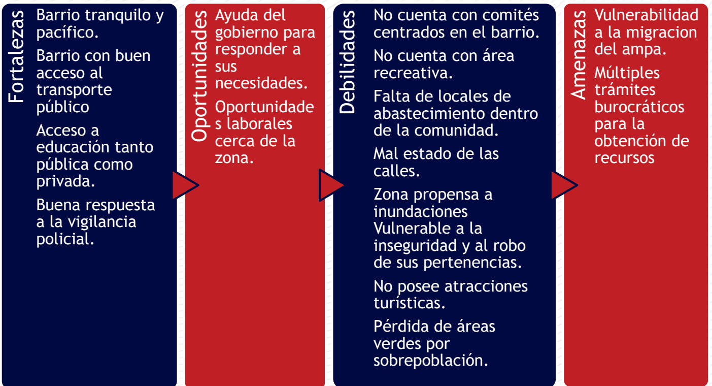
Fig. 1 Análisis FODA