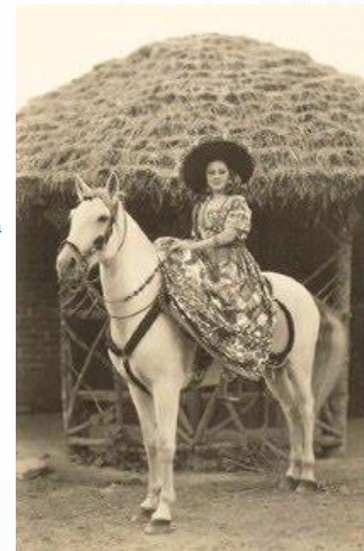
Imagen 1. Una mujer de a finales del S.XIX, montando a caballo.

De esta manera se visibiliza que la autora como viajera los proyecta textualmente a través de múltiples informaciones. Este espacio de trabajo servirá de referencia para realizar futuras investigaciones sobre libros escritos por viajeros que recorrieron Honduras y Centroamérica durante la época decimonónica.