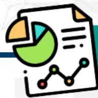
Cuadro 1. Cuadro de escala de puntuación baremo.