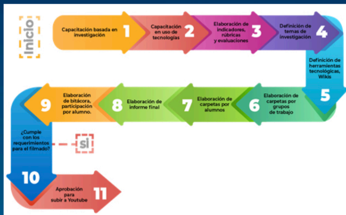
Fig. 1 Flujograma de aplicación

Al aplicar este “Método”, el alumno se empodera de un proceso de investigación, fortalece su conocimiento, además de sus habilidades blandas, como, la confianza, capacidad de relación grupal, habilidad de expresión, sobretodo, su valoración crítica del entorno de enseñanza.